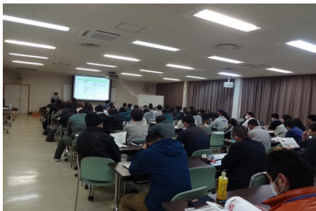
一般者向け施肥技術研修会