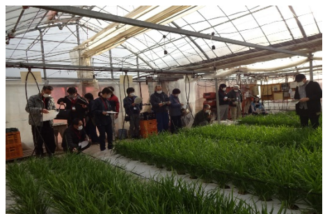
現地視察研修（ニラ栽培ほ場）