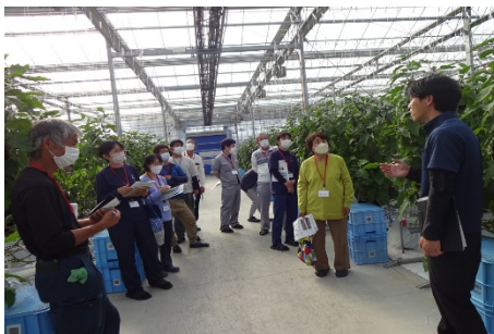
現地視察研修（ナス養液栽培施設）