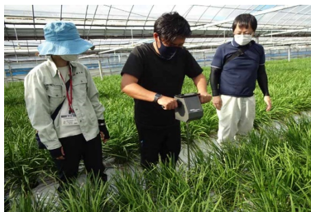
現地ほ場の土壌物理性調査