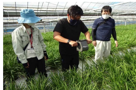
現地ほ場の土壌物理性調査