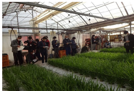
現地視察研修（ニラ栽培ほ場）