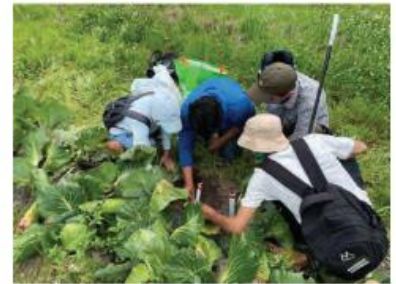
生き物調査の様子