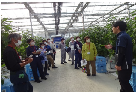
現地視察研修（ナス養液栽培施設）